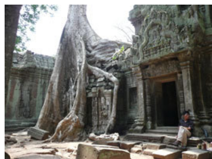
Ruinas de Ta Prohm.

El diseño de Ta Prohm, en contraposición de los clásicos templos khmeres con forma de montaña responde a un esquema plano de murallas concéntricas que rodean el santuario central aunque en el siglo XIII se añadieron varias torres sobre las gopuras (puertas de entrada) similares a las de Bayon.