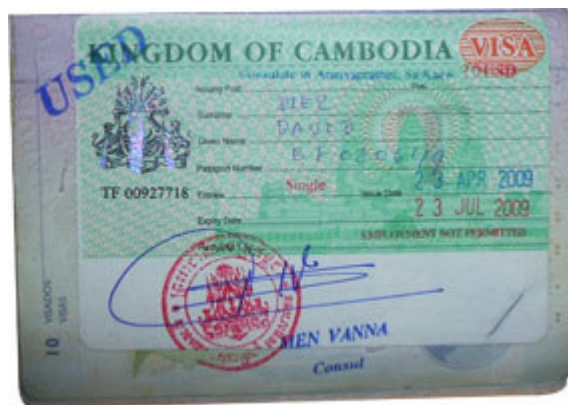
Visado oficial camboyano.

Junto al consulado (a apenas 20 metros) hay una agencia de viajes con personal camboyano a donde probablemente te conduzcan los taxistas para que te gestionen el visado (con un coste añadido), simplemente ignora sus ofrecimientos a pesar de que te intimiden diciendo que son policías camboyanos (algo completamente ilegal) o cualquier cosa y busca el consulado (muy fácil de encontrar), a partir de entonces y una vez en la frontera (a 1 km del consulado) no sigas a nadie a ningún lado ya que los tramites son los normales en un paso fronterizo.