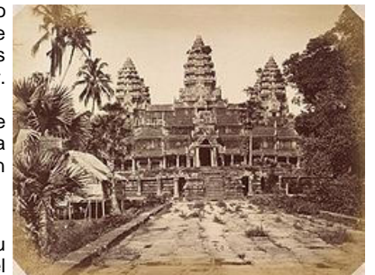
Angkor Wat tras su redescubrimiento.

Tras la caída del régimen comunista la ciudad ha vuelto a alcanzar su esplendor perdido siendo hoy en día la ciudad con mayor crecimiento del país.