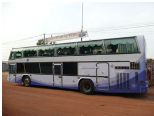
Autobús de largo recorrido en Siem Reap.

La Nacional 6 conduce desde la capital hasta Siem Reap y viceversa; los tickets se pueden adquirir en agencias turísticas que ofrecen el traslado en minibus desde su alojamiento hasta la estación de autobuses junto al trayecto hasta Siem Reap por algo más de un 30% del coste real del trayecto adquirido en la estación de autobuses.