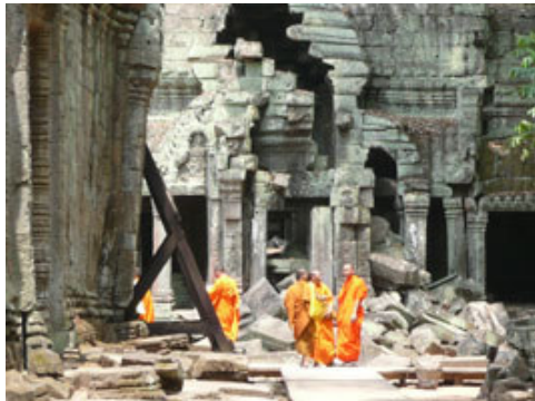
Monjes entre las ruinas de Ta Prohm.

El paisaje que rodea la ciudad es básicamente llano rodeado por cientos de campos dedicados a la agricultura del arroz que junto con la pesca y desde luego el turismo conforman la realidad económica de la zona.