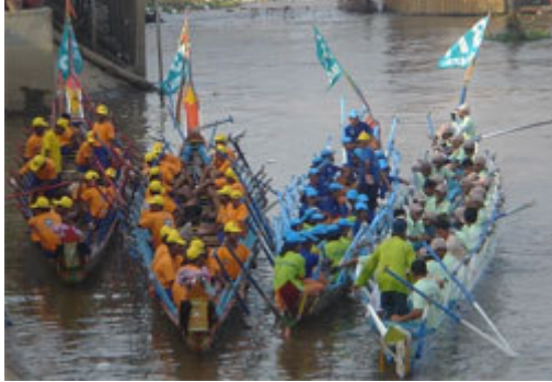
Equipos participantes en el Bon Om Tuk.

Otras fechas importantes son la independencia de Francia y la liberación de Phnom Penh de manos del régimen de los khmeres rojos.