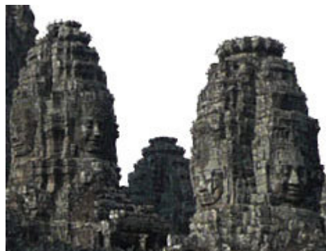
Caras en las gopuras de Bayon.

El acceso a la ciudadela generalmente se hace a través de la puerta sur ya que es la más cercana a Angkor Wat. Junto a ella se encuentran Baksei Chamkrong , un pequeño templo hindú del siglo X dedicado a Shiva que alberga una imagen dorada del dios y Phnom Bakheng , construido en el siglo IX y estupendo marco para los impresionantes amaneceres en la ciudad.