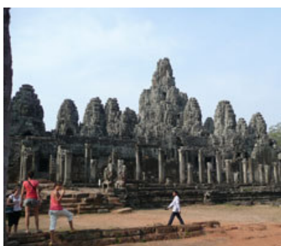
Templo de Bayon.

Angkor Thom fue fundada sobre Yasodharapura como capital del imperio khmer cuando Jayavarman VII expulsó a los Cham de Angkor Wat a finales del siglo XII. La ciudad se mantuvo como capital de Camboya hasta el siglo XVII.