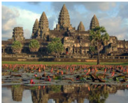
Las cinco torres del templo.

Angkor Wat es el más grande y destacado de los edificios y complejos de la ciudad sagrada, fue ordenado construir a principios del siglo XII por Suryavarman II para la diosa Visnu y es un enorme complejo templario y urbano dispuesto sobre un terreno rectangular de 1,5 x 1,3 km.