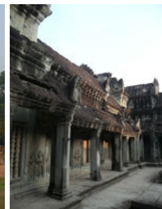
Detalle de las galerías.

Los muros exteriores simbolizan las orillas del mundo mientras que las torres centrales, reservadas como residencia de los dioses hindúes, representan al monte Meru y sus picos.