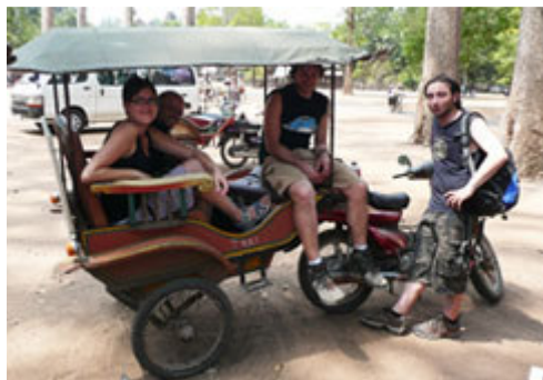
Tuk Tuk en Angkor.

La ciudad de Siem Reap es lo suficientemente pequeña como para poder ser recorrida a pie pero por comodidad se puede tomar un mototaxi o un Tuk Tuk. Su precio no es fijo ... depende de lo que negocies con el conductor.