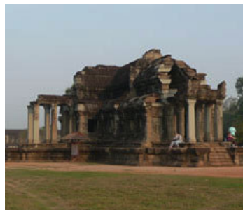
Biblioteca del templo.

Al final de la avenida se haya el templo sobre una plataforma de piedra de 332 x 258 metros. Se compone de cinco torres conectadas entre sí mediante galerías abiertas o cerradas en forma de cruces y rectángulos concéntricos que se encuentran ricamente adornadas con bajo relieves que representan apsaras (ninfas acuáticas danzarinas) y pasajes de la mitología hindú.