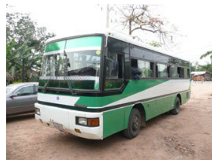
Autobus en el centro de transporte.

Las corruptas autoridades turísticas camboyanas tratan de confundir a los turistas indicando precios de los autobuses que no se corresponden con los establecidos, tratan de mantener al turista sentado en algún punto, lo mueven de un sitio a otro y en general lo mantienen distraído para que no haga nada por sí mismo. Hay que tomar el autobús al centro de transporte en el lado derecho de la rotonda.