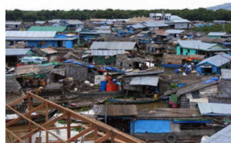
Casas flotantes en Chong Khneas.

Chong Khneas es la aldea flotante más popular, en ella viven aproximadamente 5000 personas en unas 1300 casas flotantes y desde ella operan la mayor parte de ferries y barcasas a Battambang y Phnom Penh.