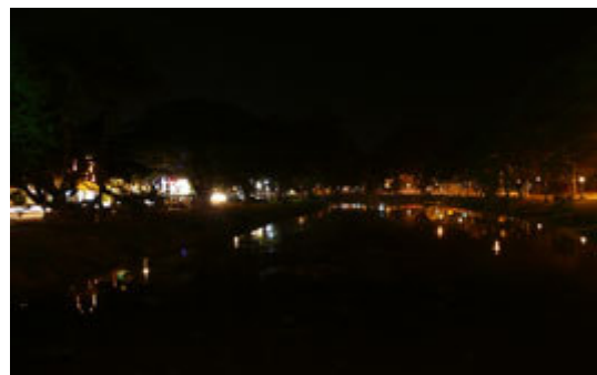
Luces de los negocios nocturnos reflejadas en el río.

El centro de la ciudad es otra cosa; la influencia occidental a traído consigo la construcción de centenares de negocios relacionados con el ocio como casas de masaje, pubs, restaurantes occidentales, discotequillas, minicasinos y bares que cierran entre las 2 y las 3 de la madrugada.