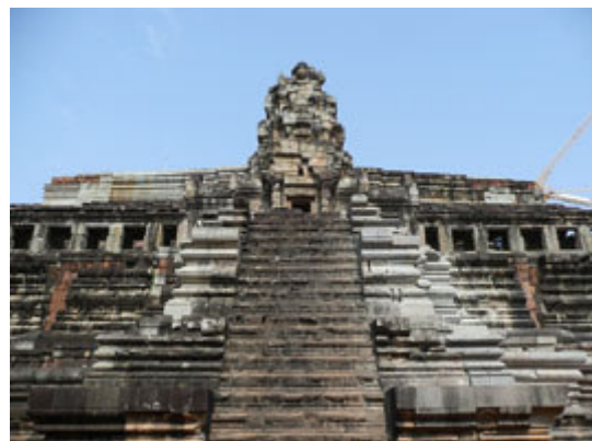
Templo montaña de Baphuon.

En el entorno turístico de Bayon se haya un área de servicios con restaurantes y tiendas además de la zona de salida y llegadas de tours en elefante.