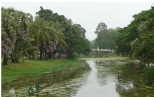
Jardines de la independencia.

La mayoría de los puntos de interés de la ciudad de Seam Reap se encuentran en torno al canal; en el cruce entre el mismo y la Nacional 6 hay un bonito conjunto de jardines llamados los " jardines de la independencia " que esconden una colección de estatuas angkorianas y frente a los que se haya la Residencia Real . Caminando por la riera del río dirección sur encontraremos el colorido barrio colonial francés que es hoy considerado el centro turístico de la ciudad.